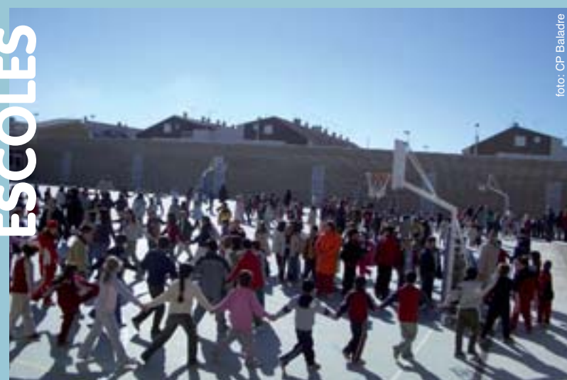
Pati del CP Baladre

El Ayuntamiento de Picanya ha iniciado una exhaustiva campaña informativa dirigida a las personas susceptibles de acceder a este servicio. Como primera medida se ha enviado una carta personal a cada persona de Picanya mayor de 60 años, también se organizó el pasado 5 de febrero una charla informativa en el Centro de Personas Mayores. Finalmente en el Ayuntamiento, tanto en las oficinas de Servicios Sociales como en el Centro de Información y Gestión (edificio Ayuntamiento, horario de 9.00 a 21.00h de lunes a viernes y sábados de 9.00 a 19.30h) se puede obtener cumplida información tanto por teléfono (961 594 460), como en persona. También puede solicitarse información a través de correo electrónico serveissocials@picanya.org . El plazo para presentar solicitudes estará abierto hasta el 14 de marzo.