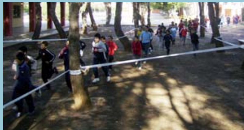
Cursa pel poliesportiu

Aquesta prova va nàixer de la il·lusió compartida per un grup de gent de diferents localitats, que van decidir aprofundir llaços d'amistat compartint el seu esport preferit. Es tracta d'una prova dura. Un recorregut d'uns 30 quilòmetres que comença en terreny pla, però que va pujant cada vegada més fins a la línia d'arribada. No obstant això, l'esperit de la prova no és la competició, sinó la unió per l'esport i, per això mateix, és una de les més esperades pels membres dels tres clubs.