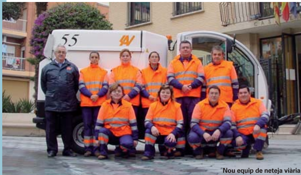
Nou equip de neteja viària

Amb aquesta campanya es tractarà de sensibilitzar les empreses del poble perquè instal·len aparcaments per a bicicletes en l'interior dels edificis, en llocs on estiguin segures. Aquests aparcaments consistiran en uns ganxos