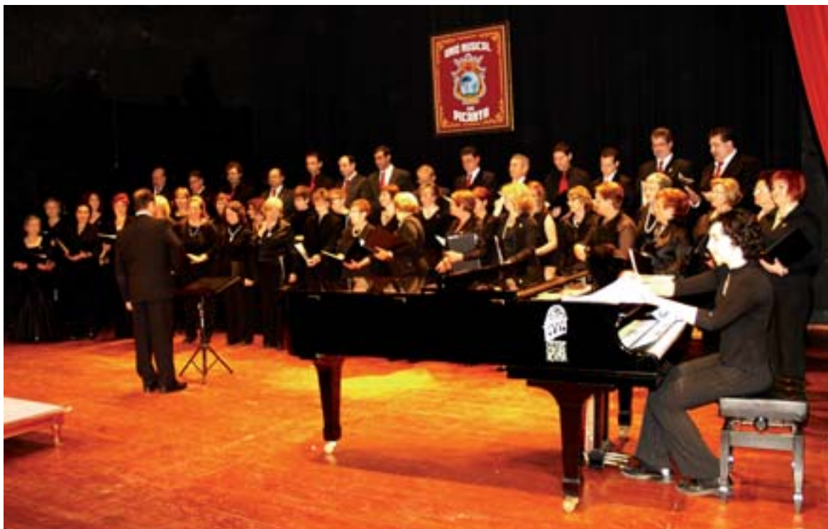
El grup coral de la Unió Musical de Picanya durant la seua actuació

25, el grup Lochlainn omplirà de malenconia celta el Centre Cultural. El 15 d'abril, la Rondalla Faitanar de Picanya oferirà una actuació on mostrarà el seu millor repertori de música mediterrània. El grup Krama actuarà el dia 6 de maig amb la seua proposta de música dels Balcans. Finalment, el dia 3 de juny, el grup Africa d'Ivori oferirà un recital ballat de música africana.