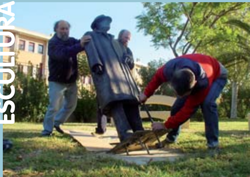
Moment d'instal·lació de la peça

L'amor, la recerca de la felicitat, les relacions entre les persones són els temes de les meues novel·les i m'agrada reivindicar que no és veritat això que diuen "quien bien te quiere te hará llorar"; jo crec que "quien bien te quiere te hará reír".