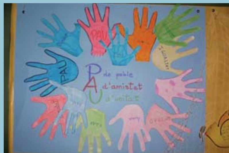
Mural al CP Ausiàs March