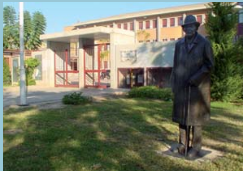
L'escultura a la porta de l'IES