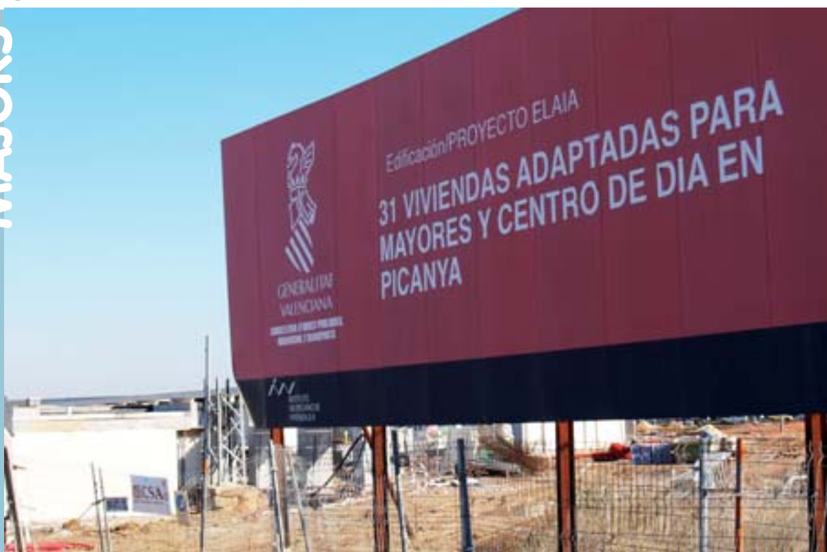
Obras de construcción del grupo de viviendas adaptadas