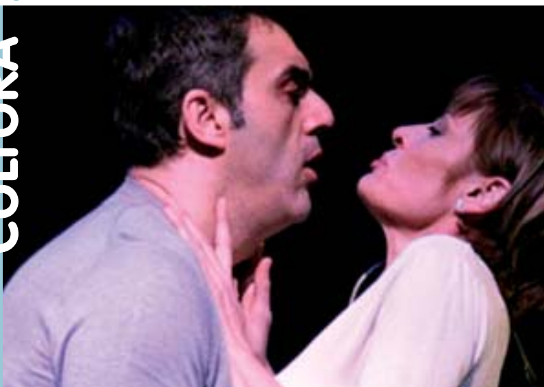
Els actors i actrius del televisiu Autoindefinitos protagonitzen 13