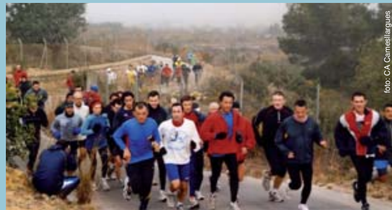
Un moment del recorregut