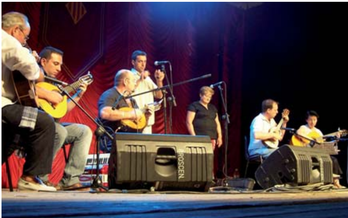
Actuació de Pep Gimeno "Botifarra" i la Rondalla