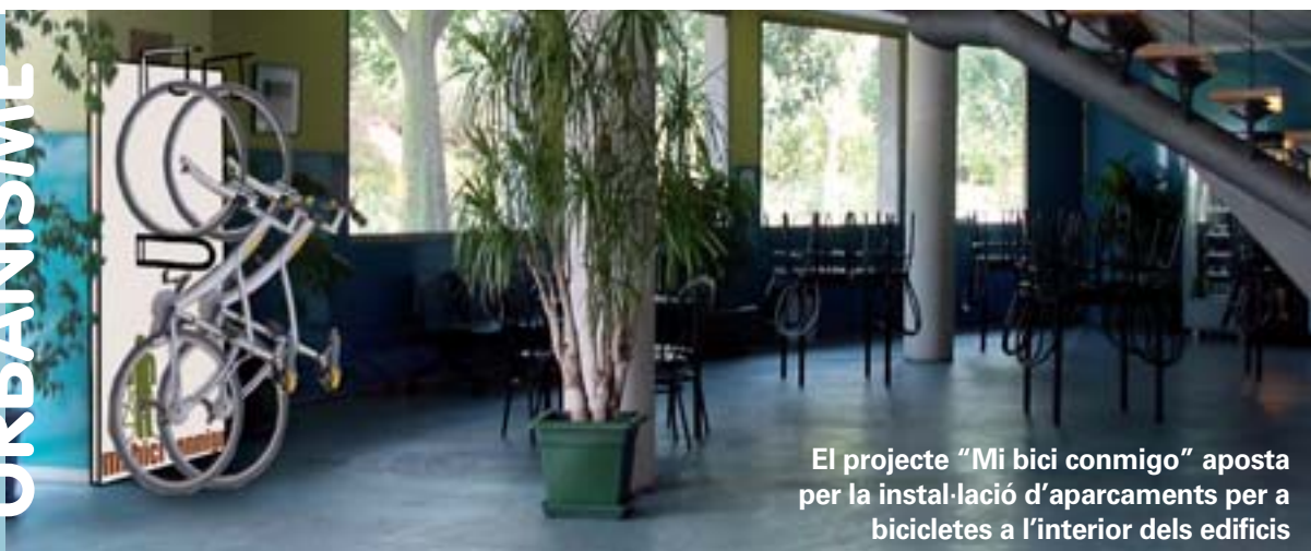
El projecte "Mi bici conmigo" aposta per la instal·lació d'aparcaments per a bicicletes a l'interior dels edificis