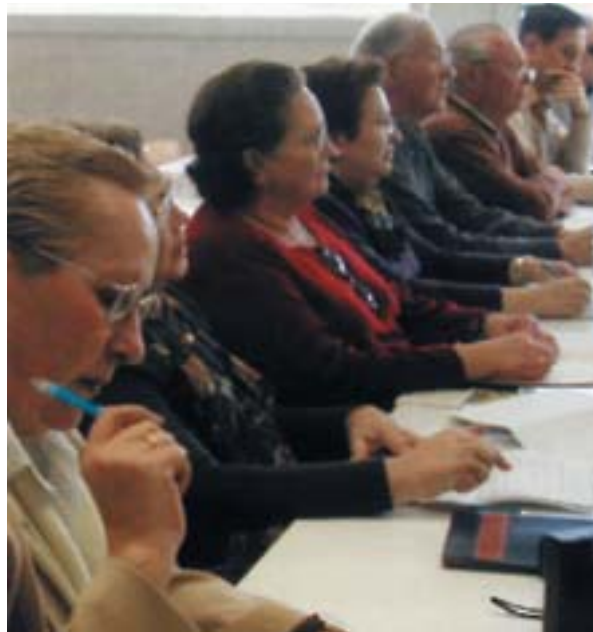
Classe a la Universitat la Florida