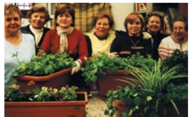
Dones al taller de jardineria