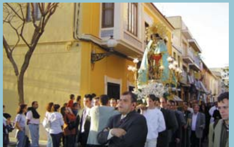
Processó pels carrers de Picanya

Finalment, el dimecres 27, dia de la Mare de Déu de Montserrat, patrona de Picanya, la vesprada va acollir els actes de la cercavila de tabal i dolçaina i la Solemne Missa cantada pel Cor Parroquial amb la participació de les Clavariesses d'aquests darrers 50 anys.