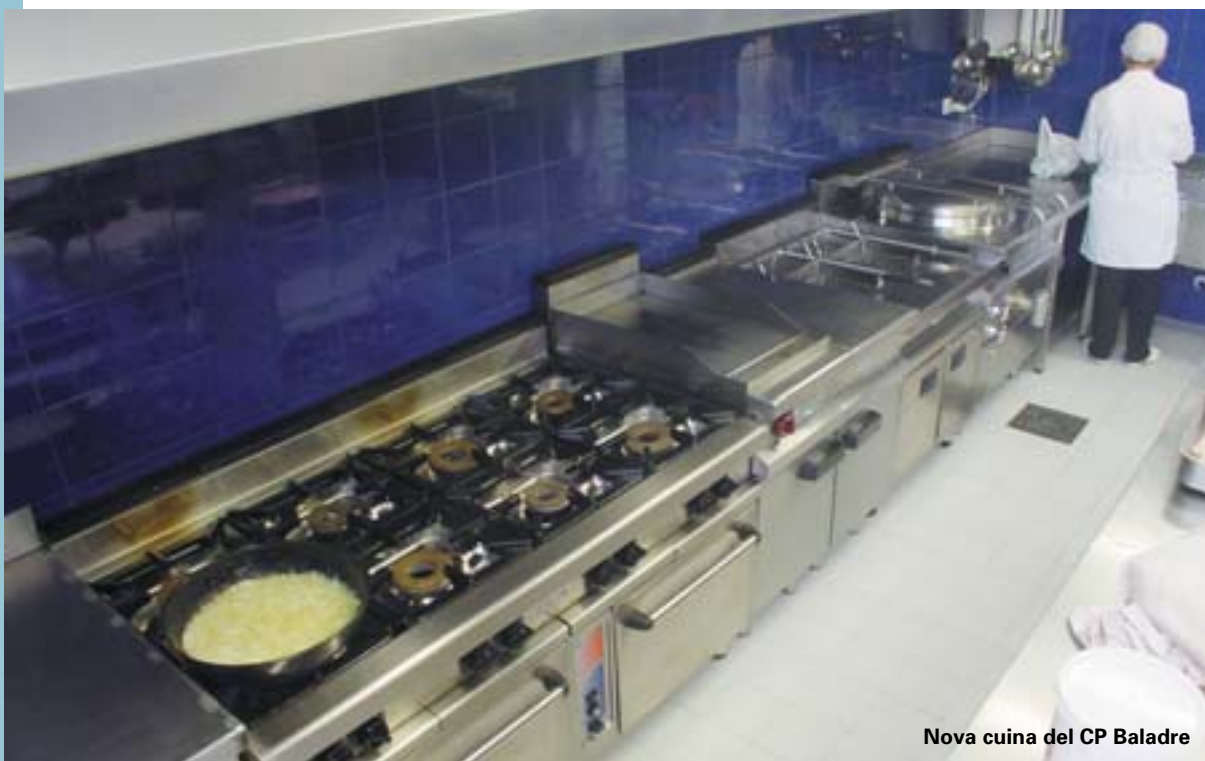
Nova cuina del CP Baladre

Els treballs per a recuperar aquest tram del Camí dels Horts s'emmarquen dins de la política de manteniment dels camins rurals que es du a terme des de l'Ajuntament els últims anys. Aquesta ha sigut la primera d'una sèrie d'actuacions a la zona sud de Picanya per a millorar els camins rurals.