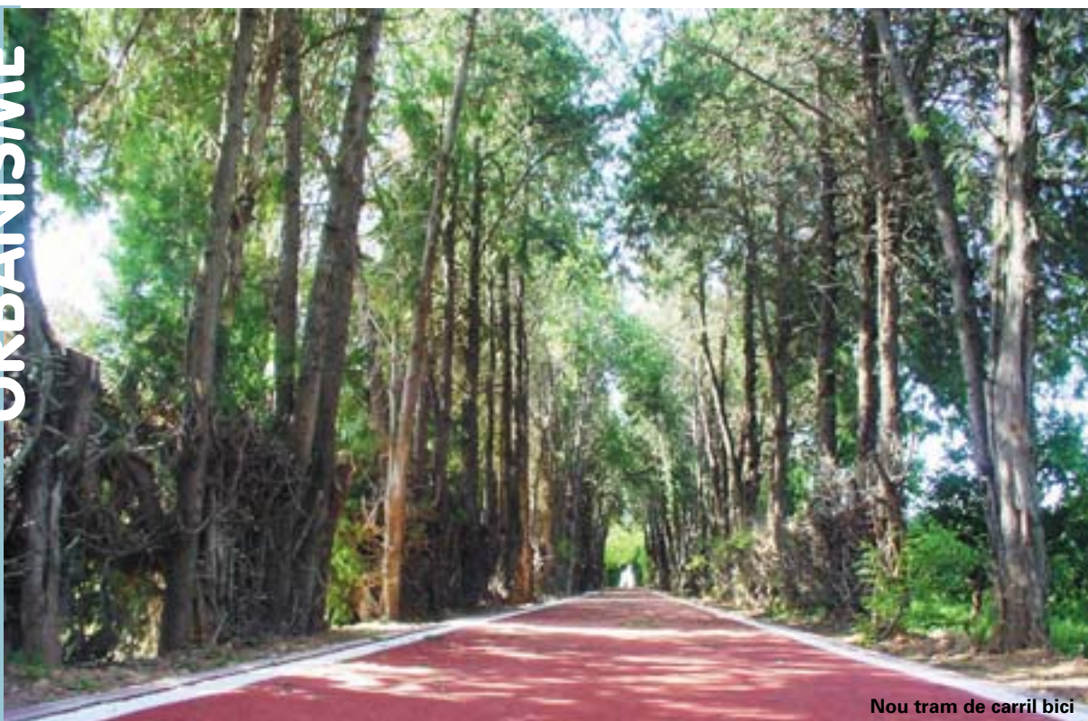
Nou tram de carril bici