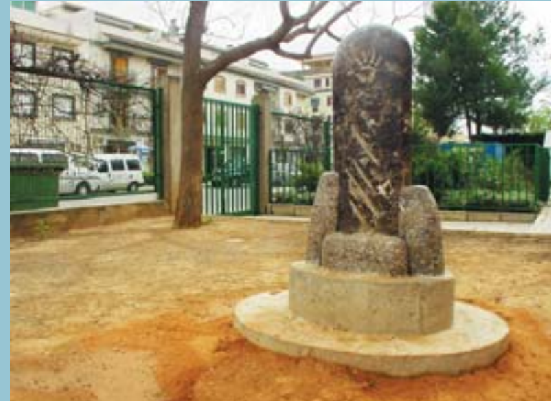
Escultura de David Díaz

Aquests cursos suposen una excel·lent possibilitat d'adquisició de formació universitària per a aquelles persones que ja fa anys que deixaren els seus estudis (o ni tan sols tingueren aquesta oportunitat) i que, pel simple plaer d'aprendre i entendre volen ampliar els seus coneixements en matèries tan variades com ara la literatura, l'economia, la igualtat de gèneres, la informàtica o el cinema.