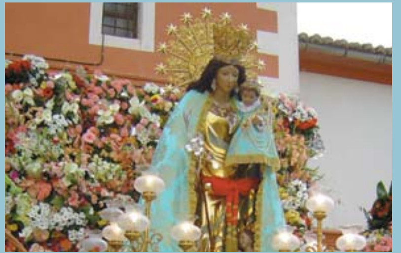
La Mare de Déu durant l'ofrena