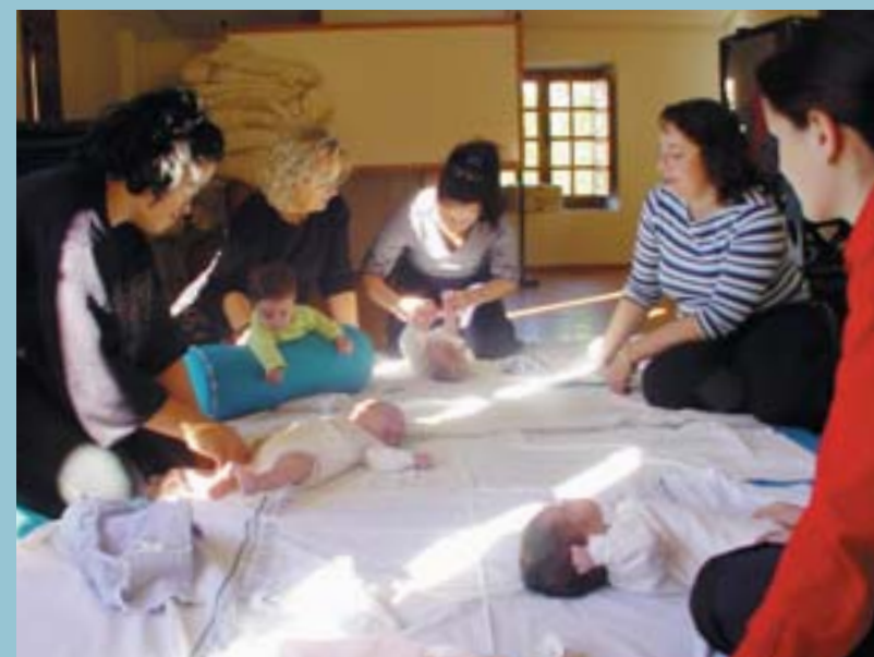
Sessió d'estimulació primerenca al Centre de Salut

Para poder establecer las relaciones siempre pedimos a las familias de los colegios que abran sus casas y faciliten el alojamiento de todas las personas que nos visitan. Tenemos Picanyeros y Picanyeras que son tradicionalmente familias acogedoras, pero, nos gustaría ampliar ese gran grupo a la vez que os invitamos a todos y todas a conocer Panazol en el viaje que la Asociación de Hermanamiento tiene previsto realizar en el mes de Octubre con motivo de la fiesta de Les Floralties