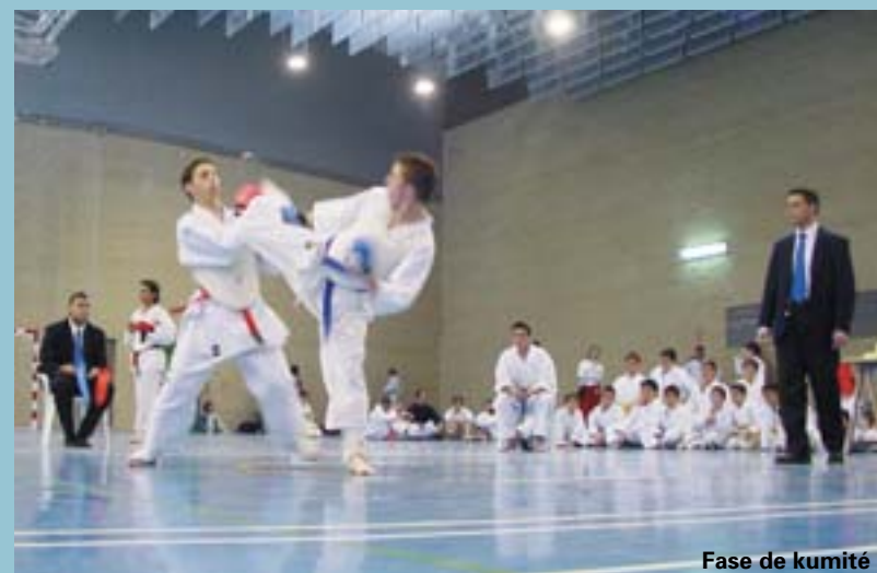
Fase de kumité

De moment continua entrenant amb els seus companys de club i espera poder entrar en la convocatòria de la selecció valenciana per al proper campionat d'Espanya per comunitats autònomes, que es disputarà el proper mes d'octubre.