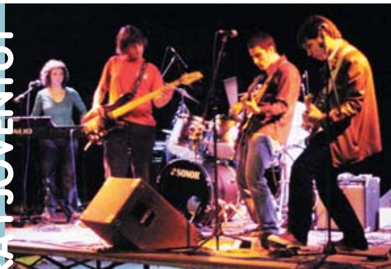
Mr. Vértigo en la seua actuació al festival "Taronja Rock"