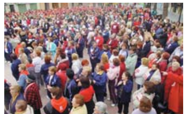
Recreo-Cross de la Dona