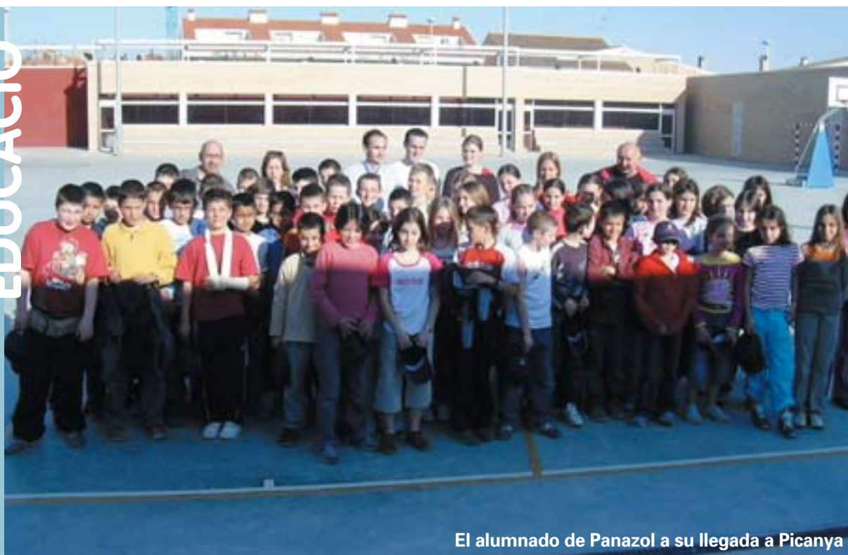
El alumnado de Panazol a su llegada a Picanya