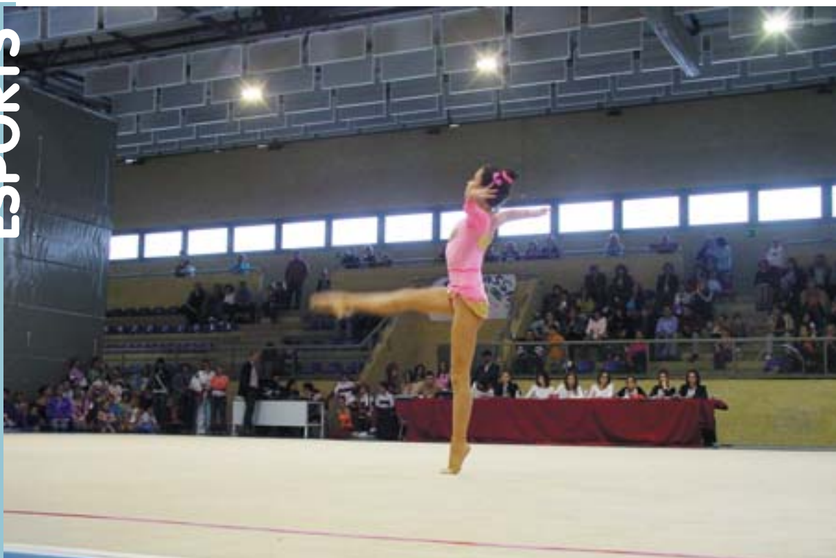
Competició del dia 17 d'abril al Pavelló