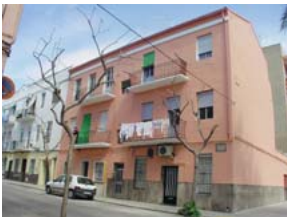
Finca rehabilitada en la calle Ramón y Cajal. Las ayudas han supuesto más del 50% de la inversión realizada

Con las ayudas tramitadas hasta hoy, la instalación de ascensor ha sido prácticamente gratuita para algunos vecinos