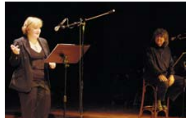
Recital de poesia al Centre Cultural

Totes aquestes línies de treball municipal (i d'altres com la utilització de llenguatge i imatges no sexistes en les publicacions municipals per exemple) tracten d'afavorir un canvi social, probablement el gran canvi d'aquest segle XXI, que va produint-se a poc a poc, amb permanents amenaces involucionistes, això sí (val comprovar els atacs rebuts per la recentment aprovada Llei Integral contra la Violència de Gènere) i al qual totes i tots hem de contribuir en el nostre quefer diari si volem fer d'aquesta societat un espai d'igualtat real entre homes i dones.