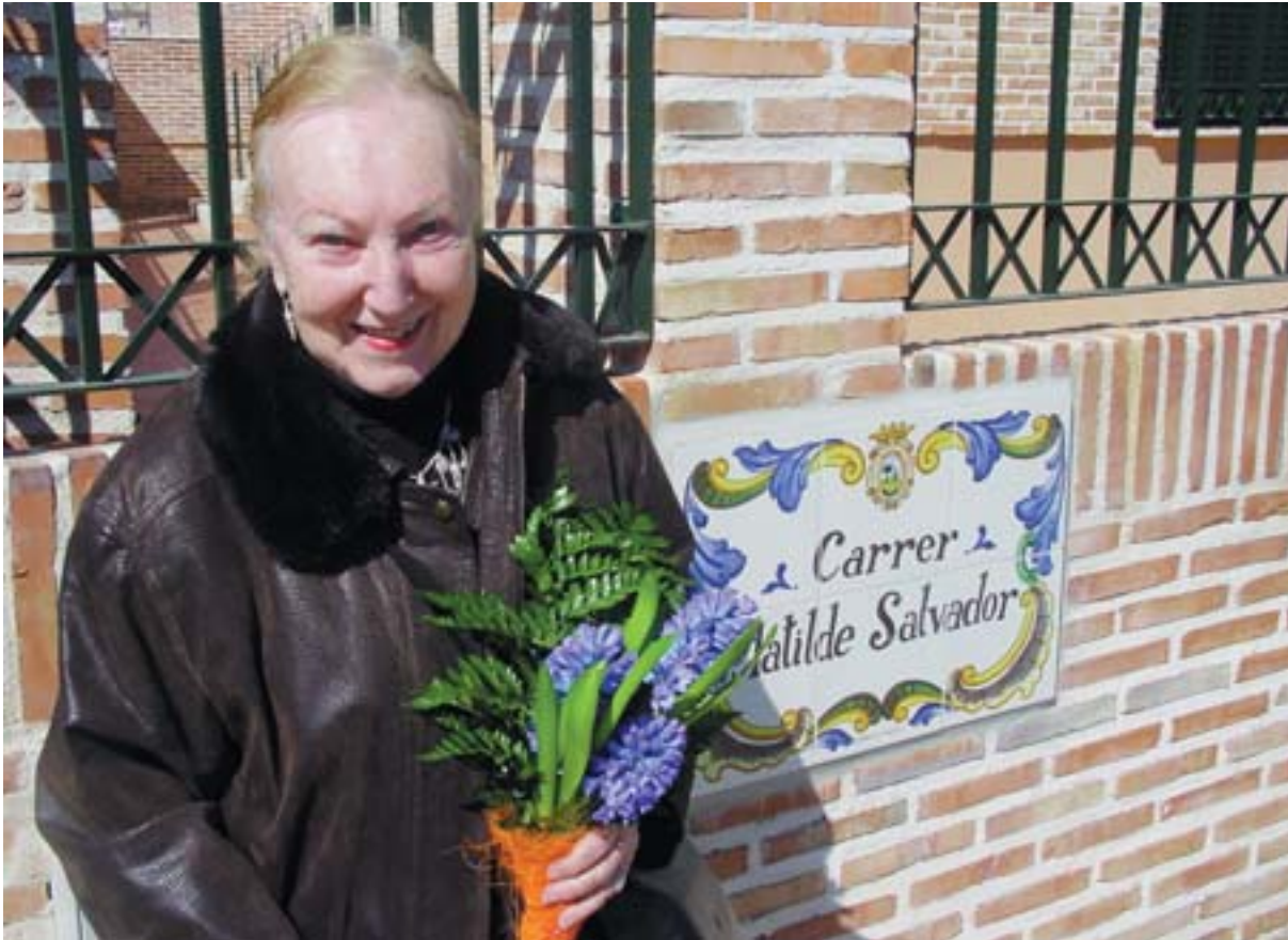
Matilde Salvador, figura fonamental de la música valenciana, és tot un exemple de dona lluitadora i compromesa. Durant la passada edició d'“Els dies de les dones” va inaugurar el seu carrer

L'arribada de la democràcia al nostre país va canviar el rol dels Ajuntaments que van passar d'un paper simplement administratiu a esdevindre autèntics factors de dinamització social. En aquest sentit, l'Ajuntament de Picanya manté, des de fa anys, una decidida posició en pro de la igualtat real entre dones i homes i treballa, mitjançant tota una sèrie d'accions i programes, per tal a millorar les condicions de vida (laborals, de formació, socials, culturals...) de les dones i fer entre totes i tots un poble (i un món) més just i igualitari on dones i homes puguin gaudir de les mateixes oportunitats per al seu desenvolupament personal.