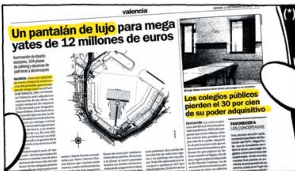
(*) Plana 3 del periòdic "Metro hoy" del divendres 11 de febrer de 2005