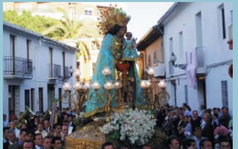
La imatge va estar acompanyada d'un nombrós públic

El divendres 22 d'abril arribava al nostre poble la venerada imatge i eixe mateix dia ja va recórrer els carrers de Picanya on va ser saludada amb salves i acompanyada pel ball dels grups de danses i les notes dels grups de tabal i dolçaina així com de la Unió Musical. La nit del divendres al dissabte la imatge va descansar al Convent on van ser les monges les encarregades d'acompanyar-la en oració fins el matí de dissabte. Eixe dia, la visita de la Mare de Déu es va dedicar a l'atenció de malalts i majors, amb una eucaristia a la parròquia i un Sagrament d'Unió de Malalts administrat de forma comunitària. Per la vesprada va realitzar-se l'ofrena de flors a la porta de l'església. Per la nit va tindre lloc l'eixida festiva i la imatge, acompanyada per veïns i veïnes així com d'alguns membres de la Unió Musical, va recórrer els carrers de Picanya i va visitar les seus de diferents associacions.