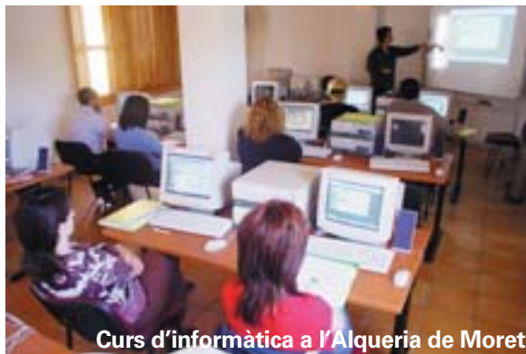
Curs d'informàtica a l'Alqueria de Moret

El passat 15 de desembre, sis alumnes van finalitzar el taller i tots han trobat treball. El 90% d'ells estan treballant com a gestors de magatzem: quatre en empreses de Picanya i dos en altres localitats. Per tant, la valoració que fem del curs, des de l'ADL, és molt positiva perquè s'hi han aconseguit els objectius marcats, fonamentalment el de proporcionar a l'alumnat la qualificació professional adient a les necessitats de les empreses, per a desenvolupar l'ocupació de gestor de magatzem.