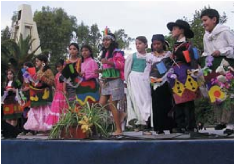
Un multicultural "ball dels cavallets" fue la aportación del folklore picanyero

El encuentro se celebró en la ciudad argentina de Rosario