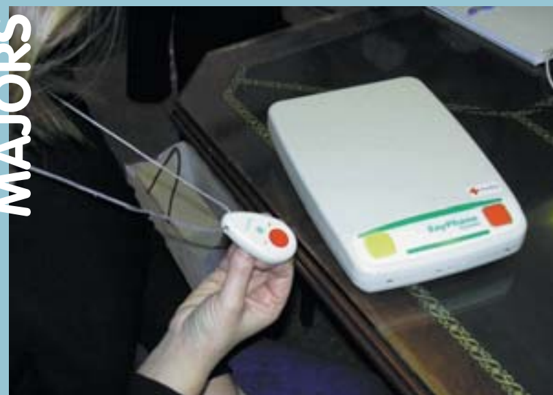
Sistema de teleasistencia