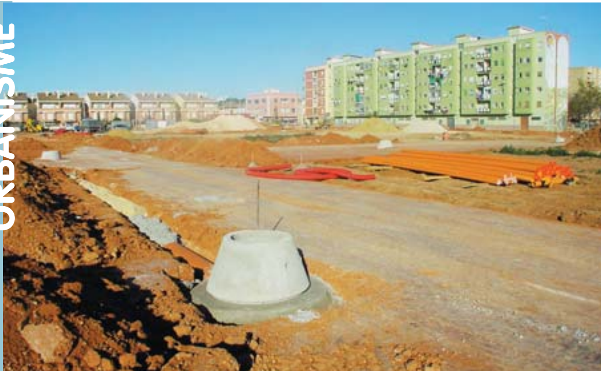
Aspecte de les obres