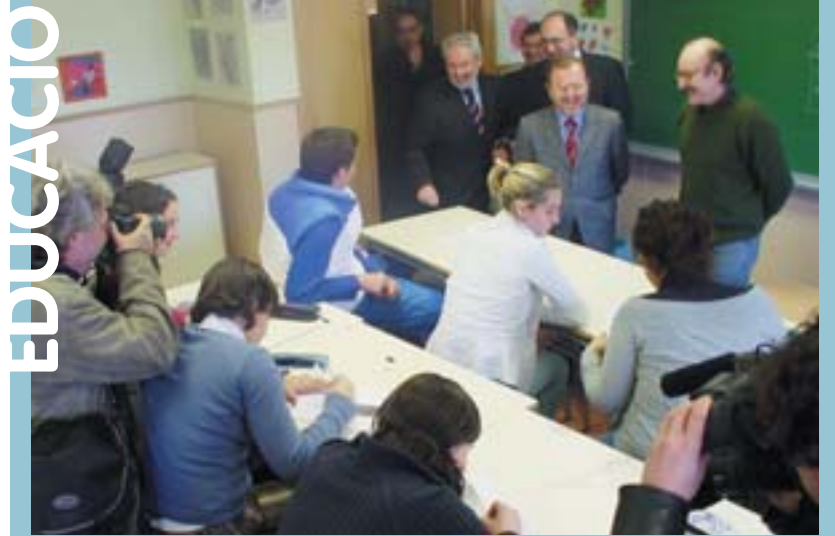
El Conseller de Cultura, Educació i Esports, Alejandro Font de Mora

Espacios como "La isla de los inventos", (antigua estación de trenes), o "El Jardín de los niños", situado en el centro de Rosario, fueron los escenarios donde niños y niñas de