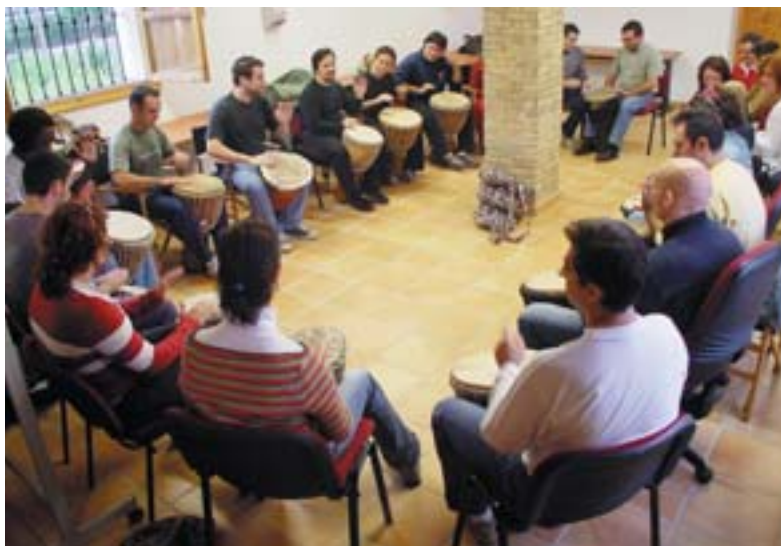
Taller de percussió africana

El divendres següent, el dia 11 de març, Nancho Novo representa Defendiendo al cavernícola , un flash back fins a la prehistòria per a contar l'origen de les relacions entre els homes i les dones.