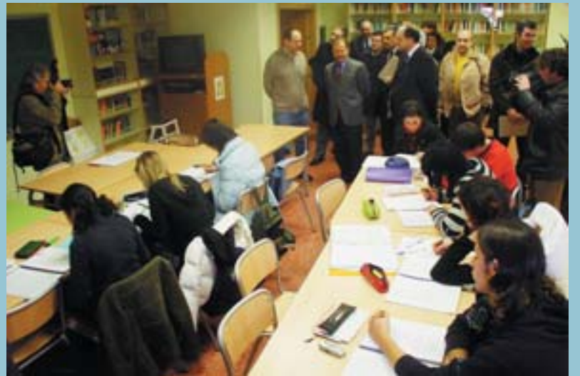
La biblioteca també va ser visitada