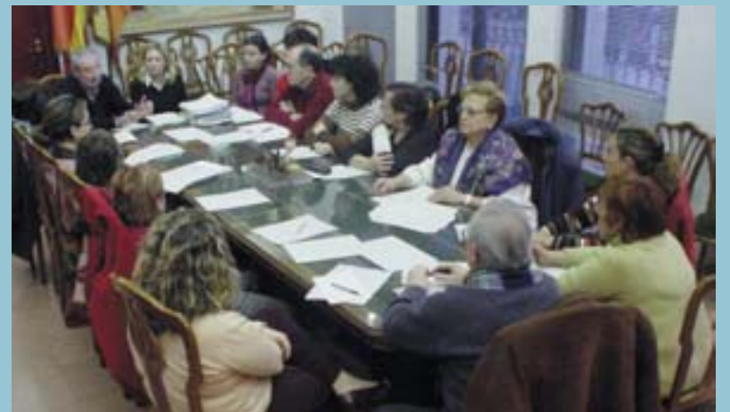
Reunió del Consell de Solidaritat

En primer lloc i com a mesura urgent se decidí destinar 18.000 euros de los fondos del Consell a los programas que la ONG Fundació Vicente Ferrer, una ONG con la que se ha trabajado ya en ocasiones anteriores y de la se tienen excelentes referencias de su labor desde ya hace muchos años en una de las zonas afectadas por la catàstrofe.