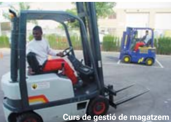
Curs de gestió de magatzem