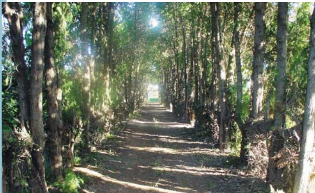
Un dels bonics racons del recorregut

Amb la urbanització d'aquest sector, quedaran resolts alguns problemes que patien els veïns i les veïnes de la zona, com per exemple l'acumulació d'aigua quan es produïen fortes pluges i a més podran gaudir d'una zona verda i d'esplai a la qual podran arribar sense necessitat de creuar el pas a nivell amb la millora de segureta que això suposa.