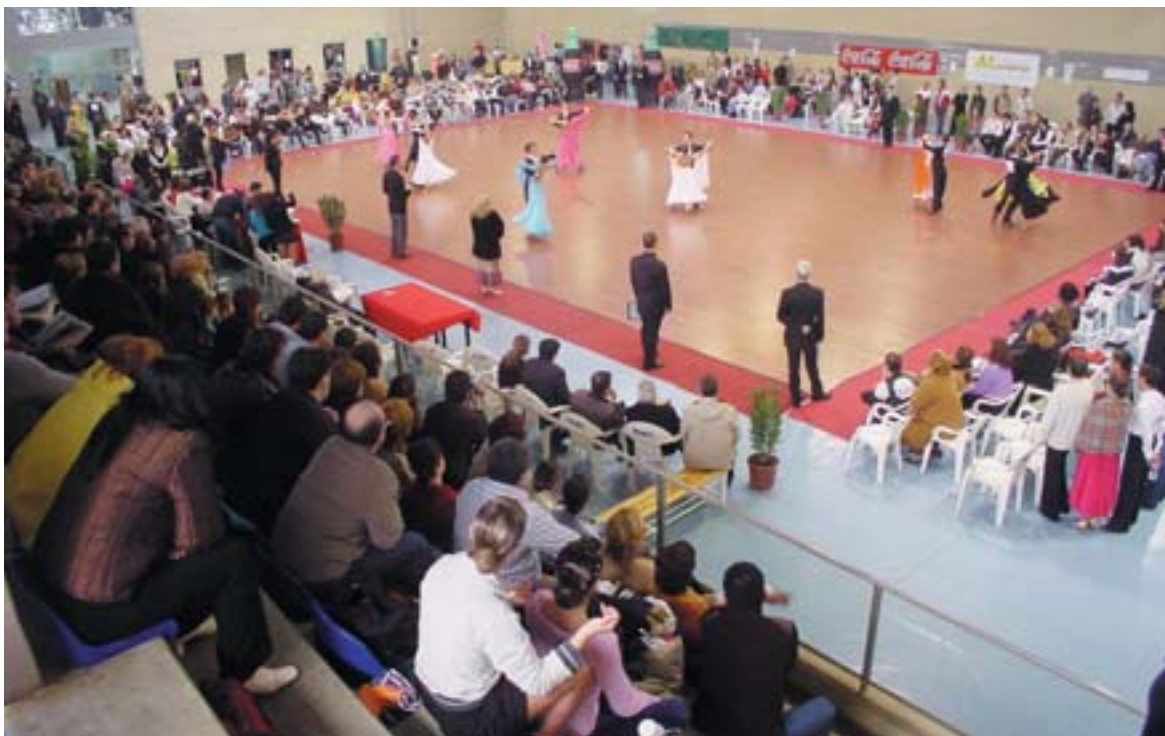
Aspecte del Pavelló durant la competició