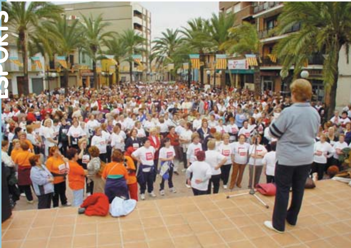
Concentració a la Pl. del País Valencià poc abans de l'eixida del Recreo-Cross