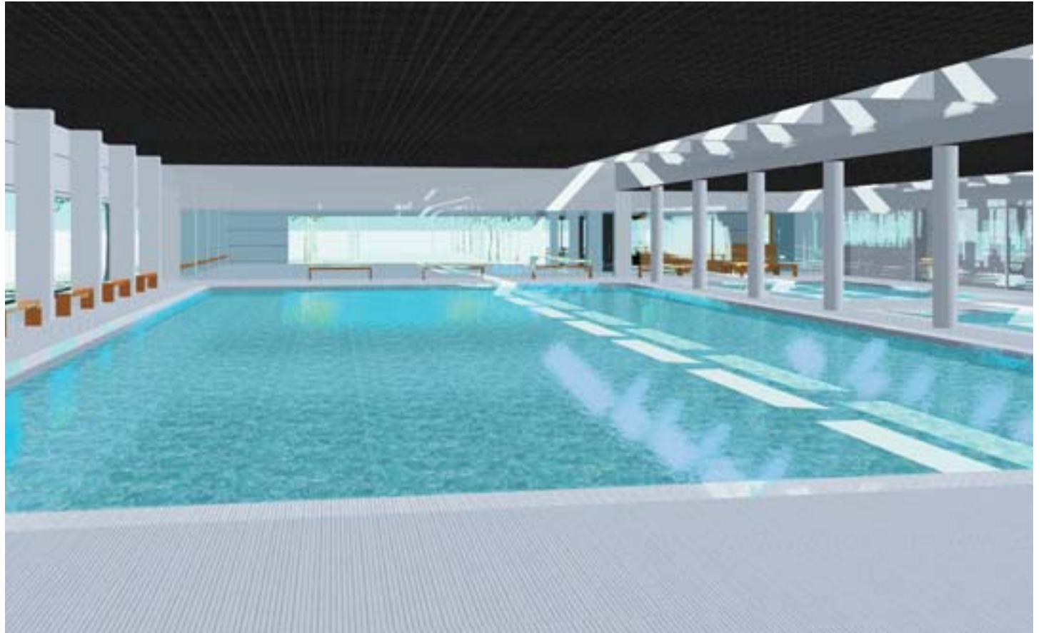
Zona de piscines

El projecte per a la construcció d'una piscina coberta a Picanya ja té una forma plenament definida. De fet, ja s'ha aprovat el projecte definitiu i s'ha adjudicat la construcció de l'edifici. L'inici de les obres està previst per a aquest mes de febrer. Es tracta d'un edifici multifuncional, amb una piscina per a la pràctica esportiva de la natació, una altra per a l'aprenentatge i una altra de relax. El que es pretén és que aquest nou equipament esportiu s'adapte a les necessitats de tots els sectors de la població.