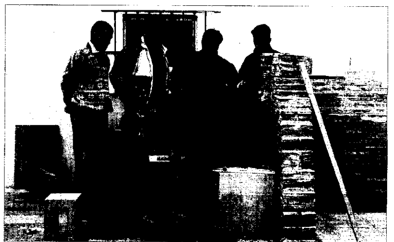
Els estudiants de França col·laboraren en el Turó d'Enric Valor