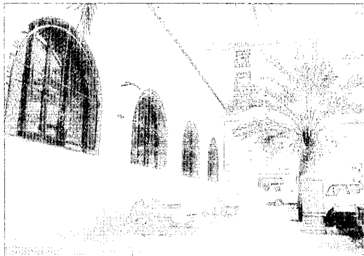
Col·legi públic Sorolla.

El passat dia 1 de desembre els alumnes, professors, pares i mares dels centres d'ensenyament de Picanya participaren en les votacions per a l'elecció dels consells escolars dels col·legis i de l'institut de la població.