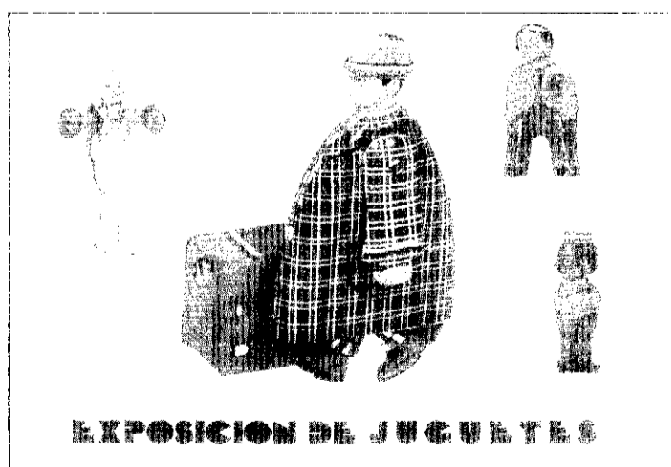
EXPOSICION DE JUGUETES

La exposición de juguetes antiguos, organizada por el Ayuntamiento de Picanya en colaboración con el Café Dimarts, ha estado compuesta, además, por todo tipo de soldados de plomo, miniaturas de coches y tre-