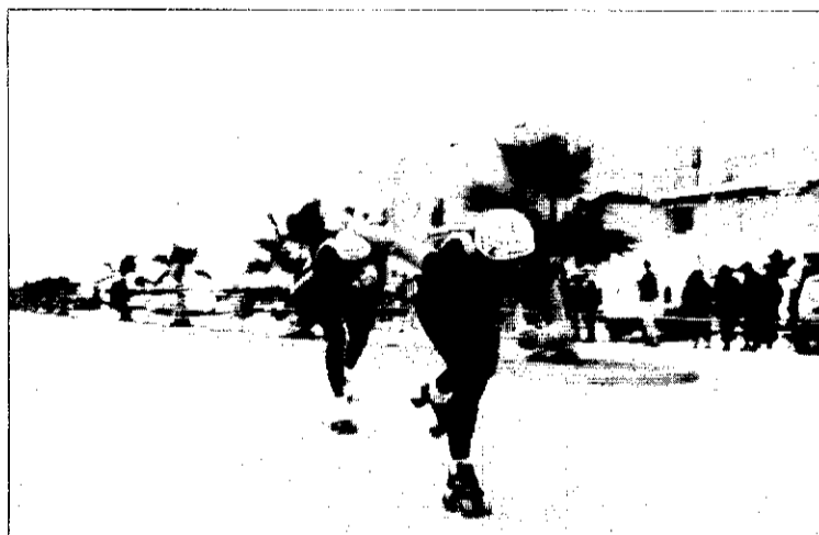
Proves de patinatge a Picanya.

L'objectiu de la creació d'aquesta escola és promocionar el patinatge en la població infantil i, per la peculiaritat que aquest esport té, permet practicar-lo individualment i per equips, d'una forma recreativa, lliure i voluntària o estricta a unes