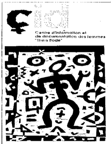
Fullet del programa.