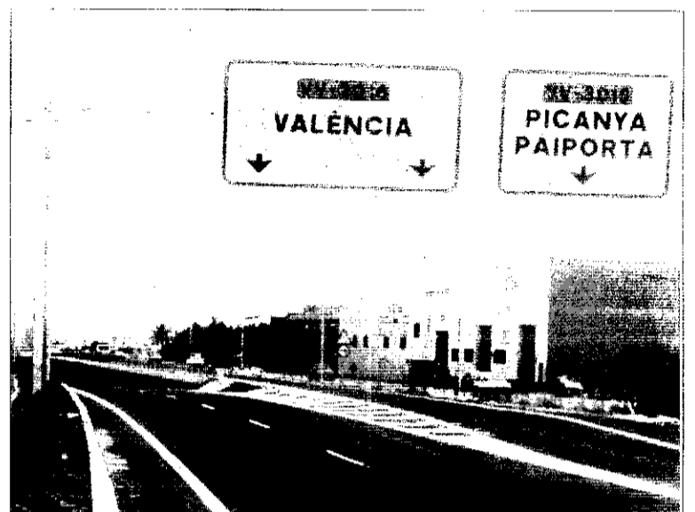
Accés a Picanya i a Paiporta en direcció a València.