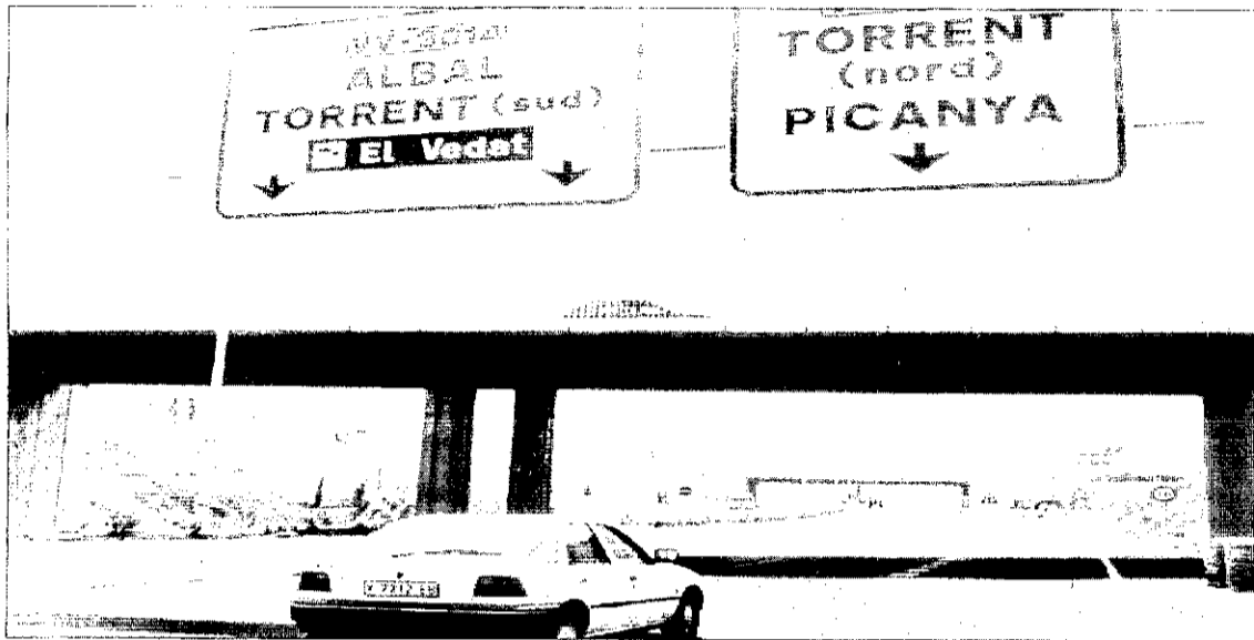
Una de les entrades a Picanya en l'autovia de Torrent.