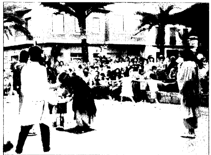
Una actuación de teatro en las fiestas del pasado año.

El patrón será homenajeado este año por todas las asociaciones de la población