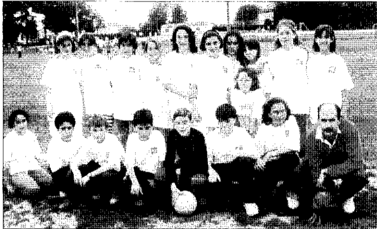
Equipo de fútbol del Ausiàs March en Panazol.

Entre otras actividades organizadas para este nuevo intercambio, el grupo disfrutará, además, de una jornada de vela en Saint Pardoux y participará en las clases